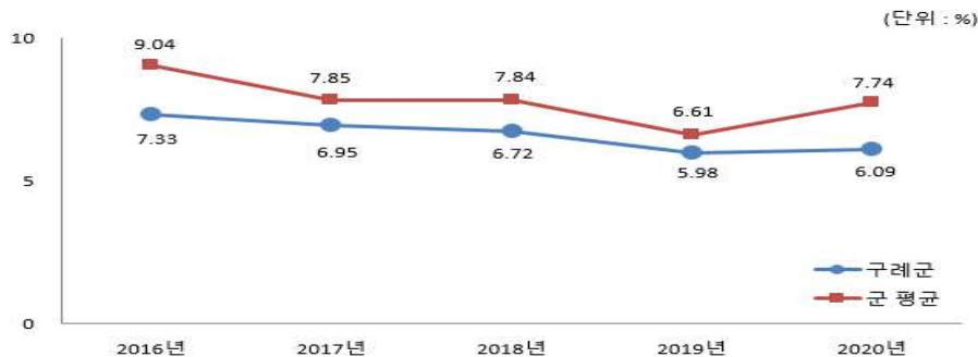
유형 지방자치단체와 재정자립도 비교