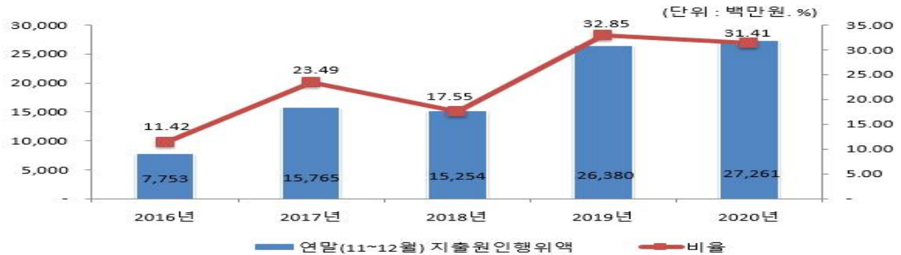
연말지출비율 연도별 변화