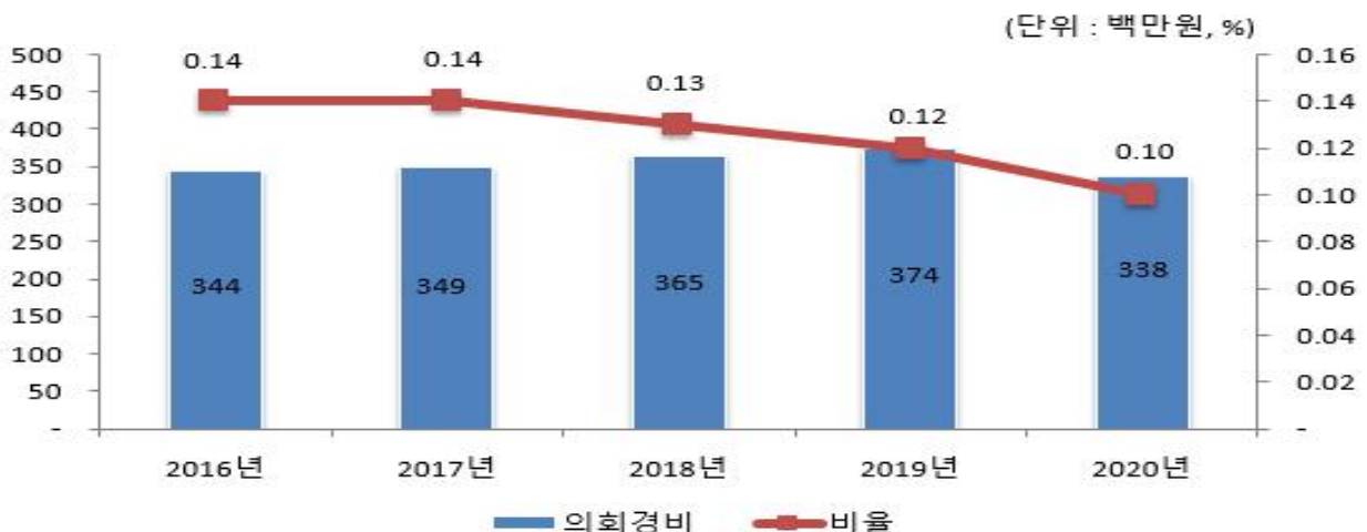
의회경비 연도별 집행액 및 비율 변화